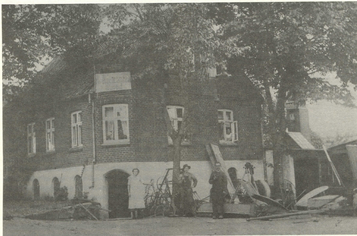
Smedien i Nim.