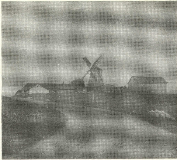
Den gamle mølle i Nim.

Men jeg frygter ikke. Thi om Nim mark end påny blev omskiftet, som han attrår, kan dog ingen tage den lod fra mig, som ermeldte stendige er begyndt på, efter forordningen og ret billighed. At jeg ikke har sat mere end henimod 70 favne, er lige så usandfærdig, thi det står for alles øjne op til landevejen fra Horsens og er over 140 favne. Jeg har desuden ladet reparere henimod 150 favne, som ganske var forfalden langs ud til landevejen, alt siden i fjor ved denne tid begyndt med stor bekostning, thi det er ikke så let, som hr. provsten behager at melde, at tage sten tæt ved diget. Nej, jeg har hver dag, der er arbejdet derpå, måttet holde en stenvogn, som jeg har ladet bekoste, med heste og 4 karle til at grave stenene op af agrene og føre dem til dem, der sætter diget, som er 3 personer, altså ialt 7 personer, som jeg har holdt og lønnet daglig ved ermeldte dige at arbejde, og jeg skulle nødes til at begynde med