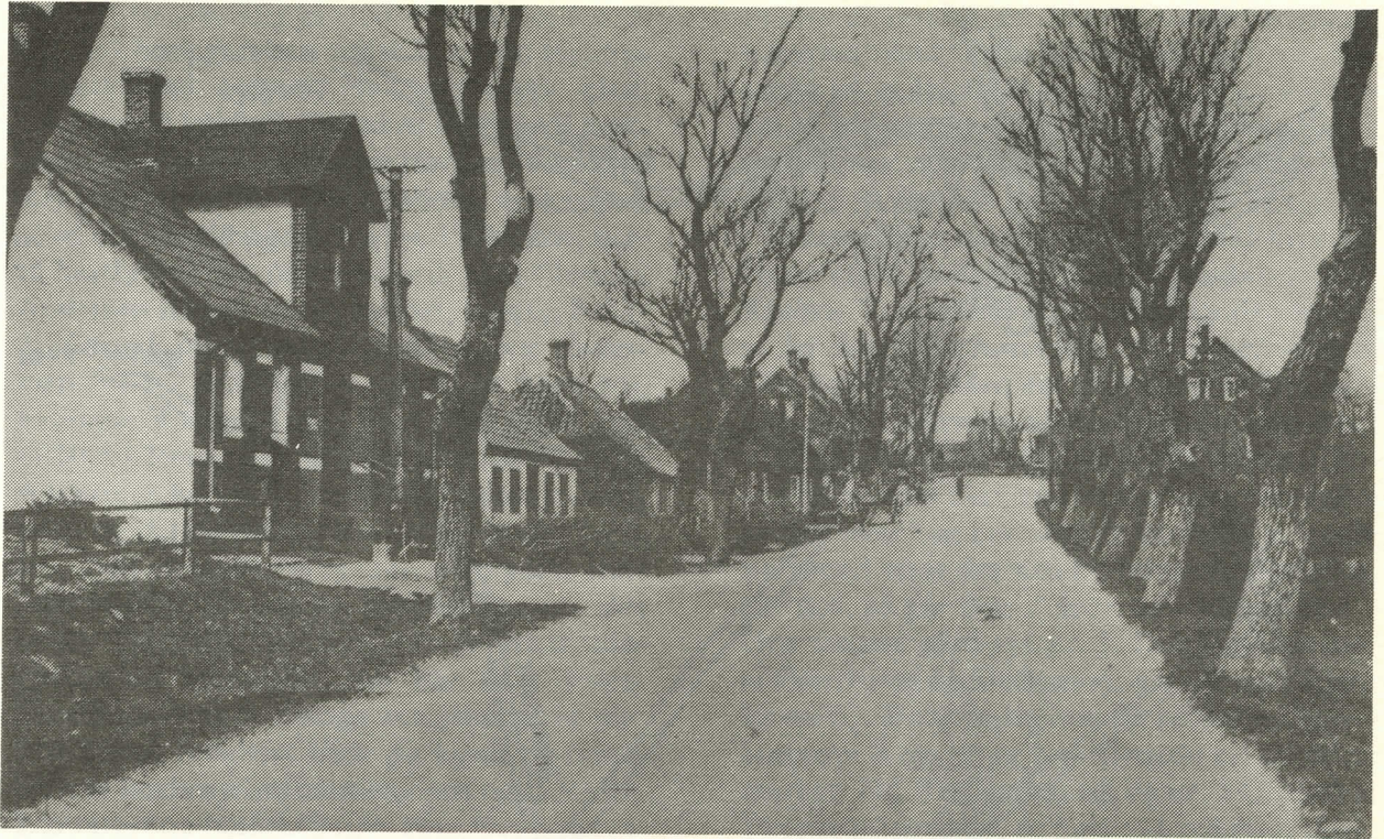
Hovedgaden i Nim.

hed om, at der skulle foretages et oversyn af dobbelte mænd, det vil sige 8 af retten udmeldte mænd mod de sædvanlige 4. Dette skete, og så gik der atter 3 år, før det afgørende åsteds-møde kunne afholdes i Nim. De fleste klager havde været over manglende enge. Landinspektør Munck foreslog nu en række mindre ændringer af englodderne. De, der havde råbt højt, fik et lille engstykke. De, der herved kom i klemme, fik erstatning i den bedste jord, og de, der som følge heraf måtte rykke, fik en større udmarkslod. Sagerne faldt i lave trods en smule murren, og alle beseglede med deres underskrift udskiftningen af Nims marker.