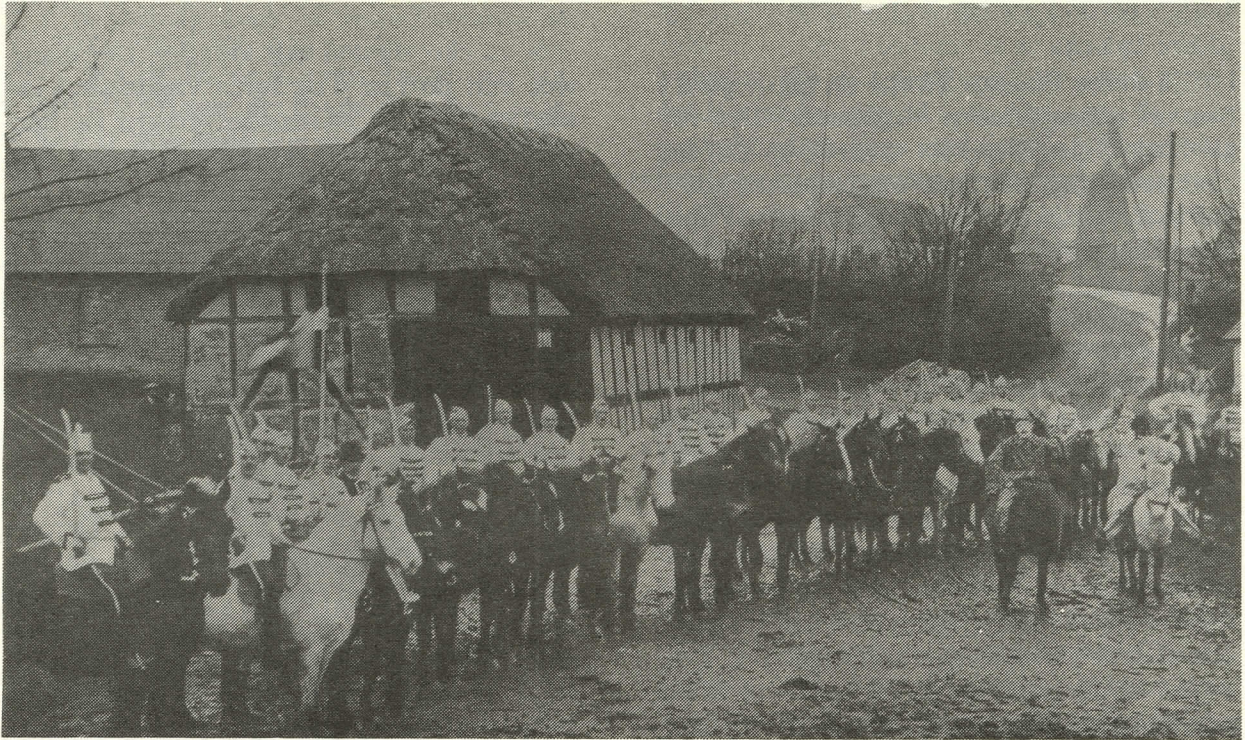
Fastelavnsryttere i Nim ca. 1914. Den gamle lade er kroladen. Vinkelbygningen krosalen.

være udenfor, når der tales om Nim sogn og by.